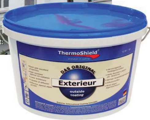
mit Exterieur beschichtet: Gründerzeitvilla, Hamburg